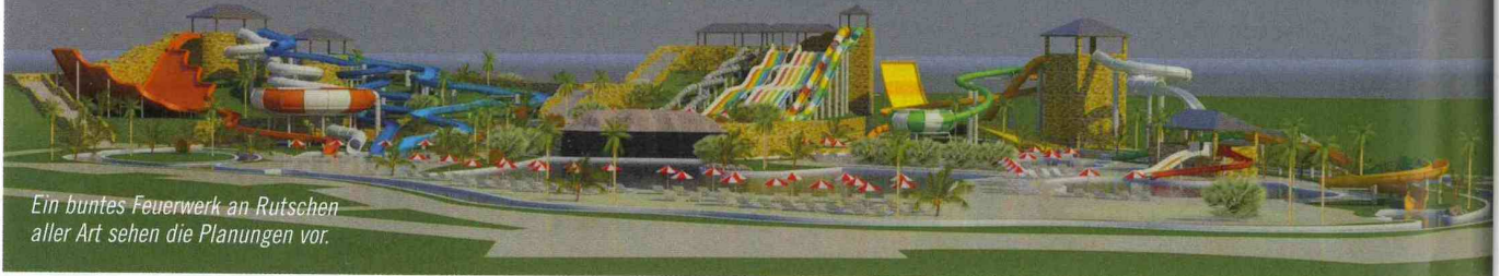
Ein buntes Feuerwerk an Rutschen aller Art sehen die Planungen vor.

Nachdem gegen Ende des letzten Jahres ein neuer Wasserpark im nordwestlichen Mai Khao auf der Insel Phuket eröffnete (wir berichteten in EAP 1/2010), soll ein Jahr später, im Dezember 2010, ein weiterer Park am zentralwestlich gelegenen Patong Beach in Betrieb gehen. Der in Zusammenarbeit zwischen dem ungarischen Unternehmen Eleven KFT und seinen thailändischen Partnern entwickelte Wasserpark soll eine Investitionssumme von etwa 18,5 Mio. Euro (25 Mio. US-Dollar) erfordern. Auf einer Gesamtfläche von 6,5 Hektar installiert der türkische Hersteller Polin 17 Wasserrutschen bzw. -attraktionen, darunter Rafting Rides, Bowl Rides, eine 6-bahnige Mattenrutsche und einen Lazy River sowie ein Kinderbecken mit einer interaktiven Wasserspielstruktur namens „Thai Jungle Aquatower“. Die direkte Verbindung einiger Rutschen mit dem Lazy River ermöglicht einen Non-Stop-Transport